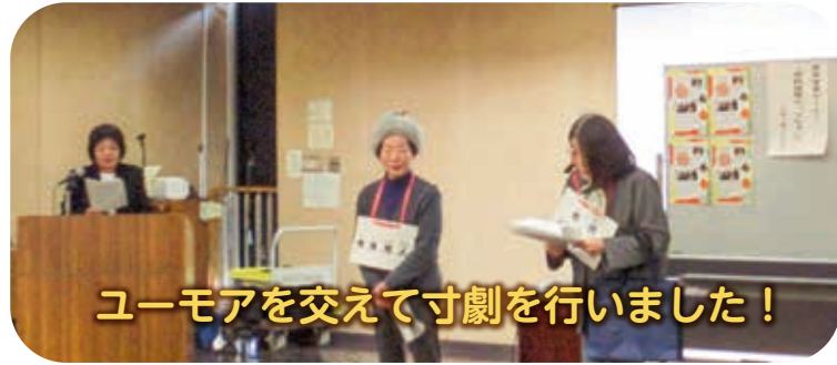
ユーモアを交えて寸劇を行いました!

令和6年3月2日(土)にプラザおおりにて、初めて市民後見人による「成年後見セミナー」を開催しました。市内で市民後見人として活動する皆さんが、自分たちの活動を寸劇やクイズを交えて伝えました。