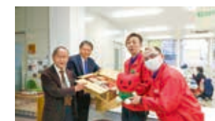
(株)マルハン島田店 様