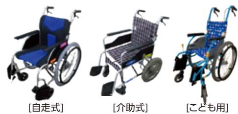
[自走式] [介助式] [こども用]

[対象] ケガ等で一時的に車いすが必要な方 [期間] 最長1か月 [料金] 無料 [貸出場所] 9か所 [申請方法] 事前にネットにてお手続き または 各貸出窓口にてお手続き ※詳細は、社協HPをご確認ください