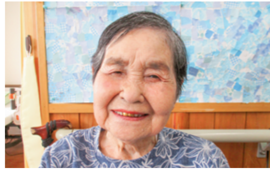
北部デイサービスセンター ～メイクによるシンデレラチャレンジ～