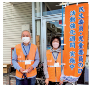
民生委員・児童委員の日 ～PR活動～