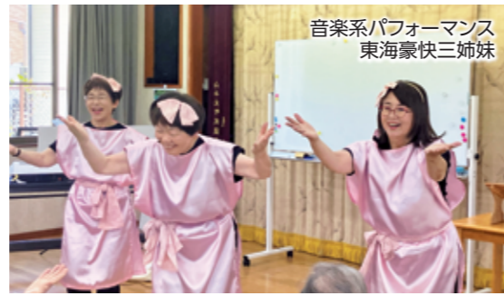
音楽系パフォーマンス 東海豪快三姉妹 特技ボランティアによる活動