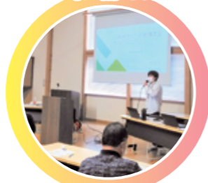
自治会への防災講座等