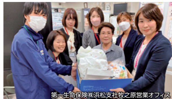
第一生命保険(株)浜松支社牧之原営業オフィス 企業の地域貢献～収集ボランティアへの協力～