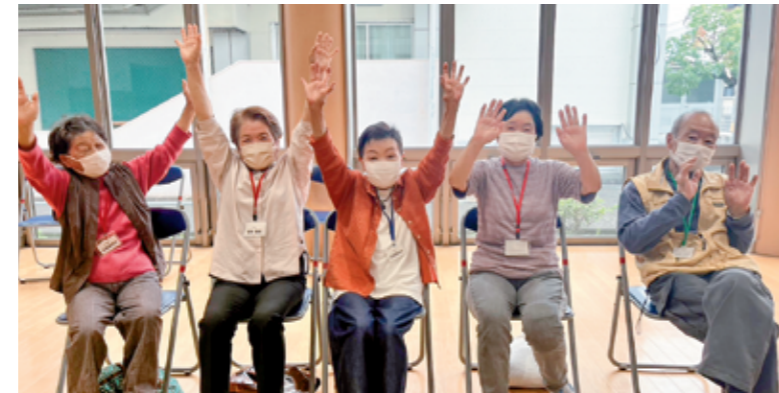
「道悦高齢者ふれあいの会」での楽しい交流♡