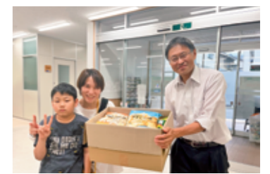
／想いをつなぎました♡