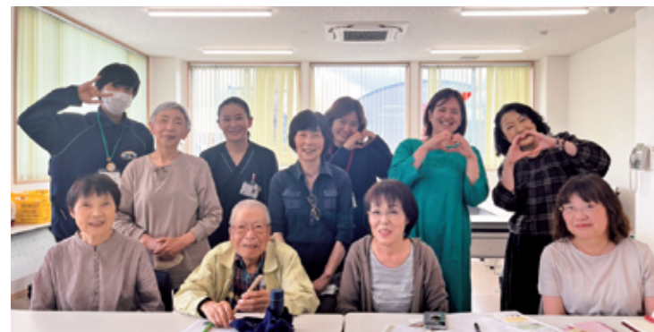
しまつなカフェ～好き♡からはじまるボランティア～