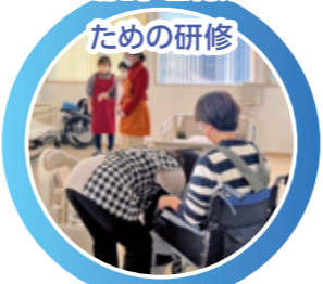
介護職員初任者研修

このまちに住むみなさんと 共に地域福祉を推進し、 誰もが安心して暮らしていける 「福祉のまちづくり」を 目指しています