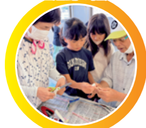
居場所での多世代交流