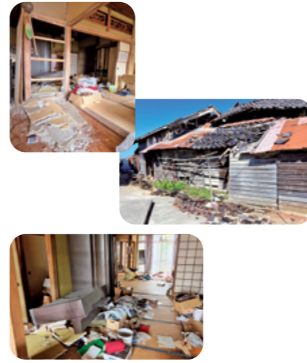
▲七尾市の様子(4月当時)