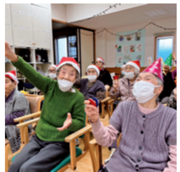
川根デイサービスセンター ～クリスマス会～