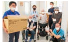
あおぞらデイサービスセンター島田 様