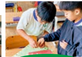
ベルマークの収集