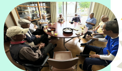
おしゃべりしながらカフェタイム☆