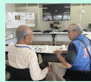
団体同士で情報交換！