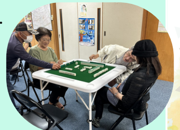
先生の頼もしい見守りとアドバイス！